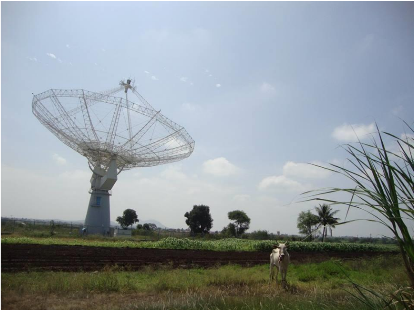
Ilustración 1: Antena más alejada de GMRT. Se puede observar el mallado de acero.

Su construcción se planeó de forma tal que el costo y el peso de cada antena sea bajo. Es por eso que los discos parabólicos de las antenas no son sólidos sino que poseen un mallado de acero con un grillado de 10 \times 10 \text{ mm}^2 en la parte central y 20 \times 20 \text{ mm}^2 en la parte externa (ver ilustración 1). El lugar no fue elegido al azar; se consideró que la interferencia producida por el hombre en la banda de radio sea baja, que exista una buena disponibilidad en las comunicaciones, y, un hecho importante es que la latitud geográfica sea lo suficientemente al norte del ecuador magnético para que la ionósfera sea estable. La latitud a la que se encuentra no sólo permite observar el hemisferio norte sino también una gran porción del hemisferio sur.