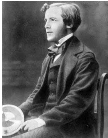
Figura 1. James Clerk Maxwell

La unidad fundamental de la electricidad es el electrón, descubierto experimentalmente hace poco más de un siglo, en 1898 por J. J. Thomson; esta partícula elemental es un constituyente básico del átomo y posee una carga eléctrica indivisible. Las cargas eléctricas pueden estar en reposo o en movimiento. Por ejemplo en un conductor metálico hay electrones libres y es el movimiento de estas cargas bajo la influencia de un campo eléctrico lo que produce las corrientes eléctricas. Magnetos como el hierro, níquel, cobalto, entre otros, son fuentes del campo magnético. Imanes con polos opuestos se atraen y se repelen si tienen polos iguales.