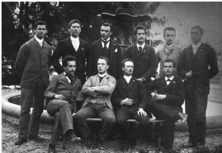
Figura 4. Einstein junto a sus compañeros de clase en el ETH.

En sus días de estudiante en el ETH, Einstein no se caracterizó por atender regularmente a clases; prefería estudiar aquellos temas de la física que pensaba eran relevantes. Por ejemplo, nunca se interesó por el curso Introducción a la Física Teórica dictado por uno de sus profesores, Weber, ya que lo creía un típico representante de la física clásica que simplemente ignoraba todo después de Helmholtz 2 . No todos sus profesores pertenecían a la categoría de Weber: en varias ocasiones Einstein destacó como excelentes profesores de matemática a Adolf Hurwitz y Hermann Minkowski. Este último no guardaría un buen recuerdo de Einstein como alumno.