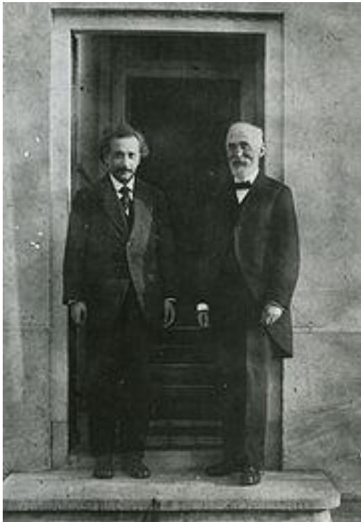
Figura 3. Einstein y Lorentz fotografiados por Ehrenfest en la puerta de su casa en Leiden en 1921.

Sólo un año antes de la aparición de la Teoría Especial de la Relatividad, en el International Congress of Arts and Science en St. Louis, Poincarè cuestiona la existencia del éter, objeta el concepto de velocidad absoluta y simultaneidad e intuye que acaso una nueva dinámica debe construirse donde la velocidad de la luz es el límite máximo para la velocidad de los cuerpos. Poincarè fue un visionario y el último “universalista” (después de Gauss) capaz de entender y contribuir en todos los ámbitos de la disciplina matemática.