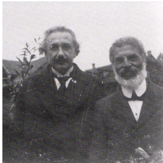
Figura 5. Einstein y su amigo Michele Besso.

El núcleo de la formulación de la nueva teoría está contenido en dos postulados. Los dos postulados de la teoría son: