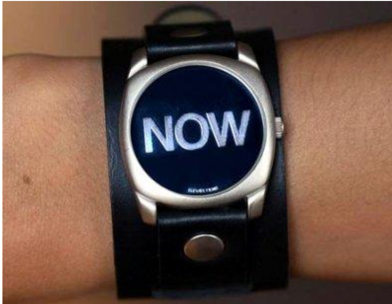
Figura 2. "Ahora" es una palabra cuyo significado depende del contexto.

similar, decir que estoy aquí, no da ninguna información de donde estoy. No hay ningún momento particular del tiempo definido como un 'ahora' absoluto.