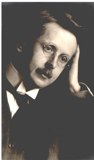
Figura 5. Hermann Weyl (1885-1955).

El mundo objetivo simplemente es , no transcurre . Sólo mi conciencia, subiendo por la línea de mi vida, hace que una sección de este mundo torne a la vida como una imagen fugaz en el espacio que cambia continuamente en el tiempo.