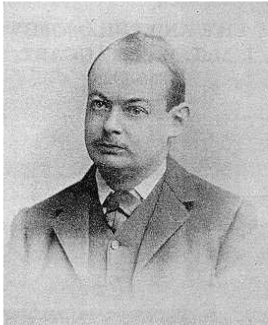
Figura 1. John Mc Taggart (1866 - 1925)